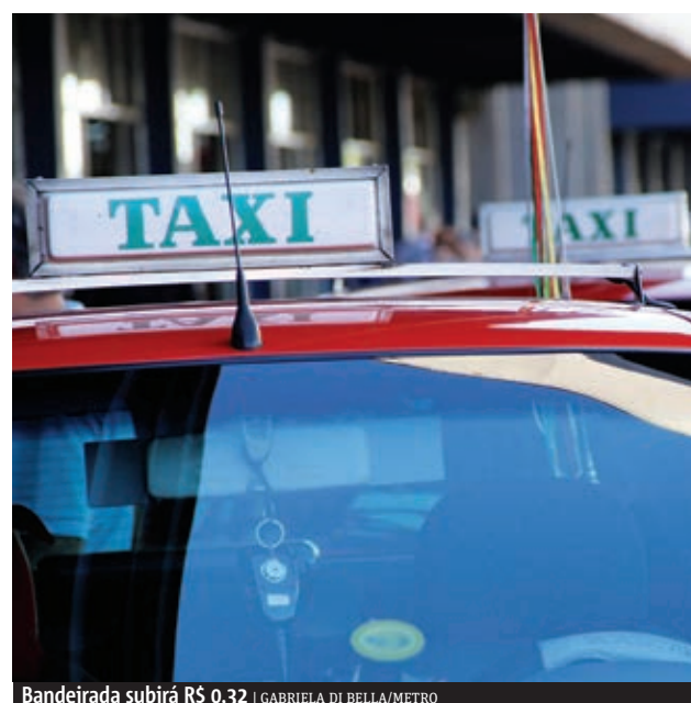
Bandeirada subirá R$ 0,32

Atualmente, Porto Alegre conta com uma frota de 3.925 táxis em circulação. Por dia, a frota transporta em torno de 200 mil passageiros. A tarifa, desde a década passada, é a mesma para os veículos brancos que funcionam exclusivamente no aeroporto Salgado Filho e os demais, vermelhos.